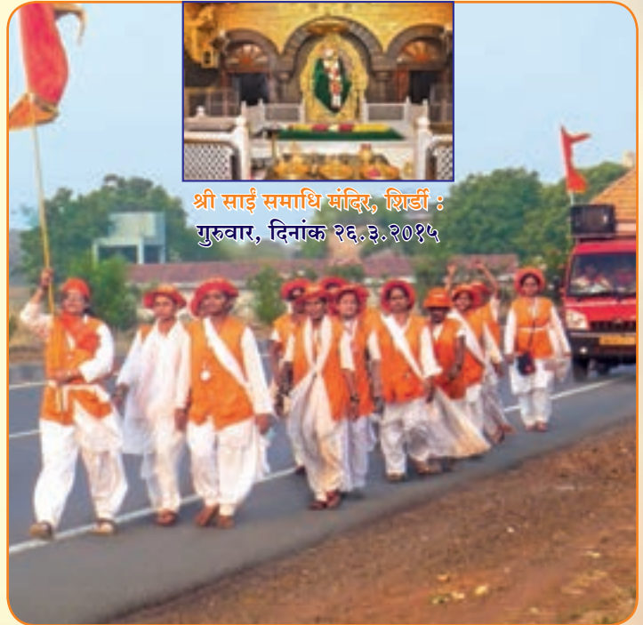
श्री साईं समाधि मंदिर, शिर्डी : गुरुवार, दिनांक १६.३.२०१५

‘ॐ श्री साईं शक्ति महिला पदयात्रा मण्डल’