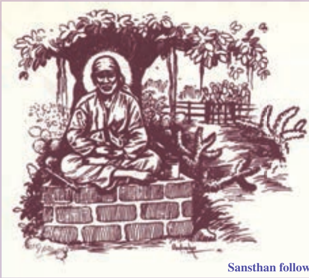
Sansthan follows this tradition of Sai