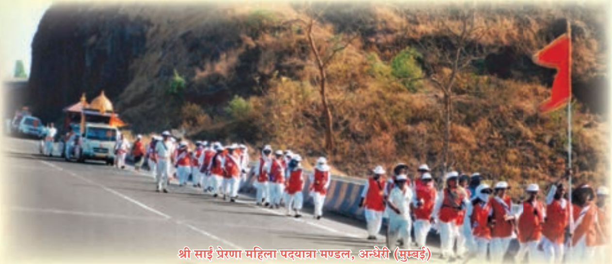
श्री साई प्रेरणा महिला पदयात्रा मण्डल, अन्धेरी (मुम्बई)

ही है, न्यारा ही है! वे मानती है कि यह कार्य करना मुझे बेहद अच्छा लगता है। बाबा की प्रत्येक बात या उनकी इच्छा पूर्ण हो, ऐसा मैं सदैव मानती आई हूँ। यह जीवन उनका ही तो दिया हुआ है। बाबा की जी-जान से सेवा करने में ही जीवन की सार्थकता है। उसी में सही आनंद समाया हुआ है। बाबा कहते है कि हर एक जीव में 'मैं' बिराजमान हूँ। इस 'मैं' यानी कि बाबा की सेवा करने का मौका मिलना परम सौभाग्य की बात है।