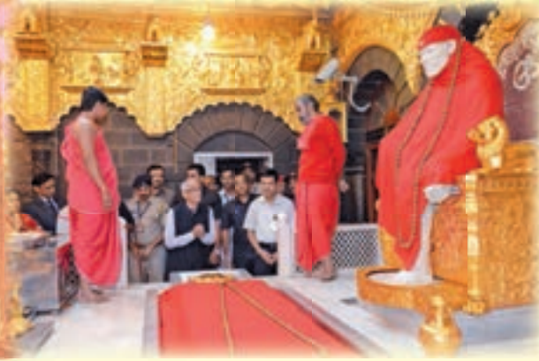
Wednesday, March 4, 2015 : The Governor of Gujarat Sri O. P. Kohli...