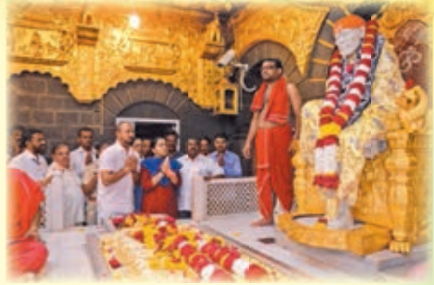
Monday, March 16, 2015 : Cricketer Sri Murali Kartik...

श्रीसाईसेवापदयात्रीमण्डल (वर्तकनगर, ज़िला ठाणे, महाराष्ट्र) के पदाधिकारियों के आह्वान के अनुसार मण्डल के १०७ पदयात्री संस्थान से प्रकाशित 'श्री साई लीला' द्विमासिक पत्रिका के सदस्य बने।